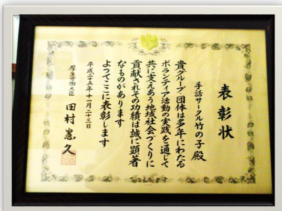
厚生労働大臣 受賞