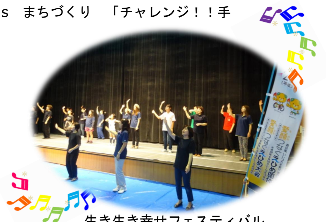
生き生き幸せフェスティバル 手話ソング「えがおは君のためにある」