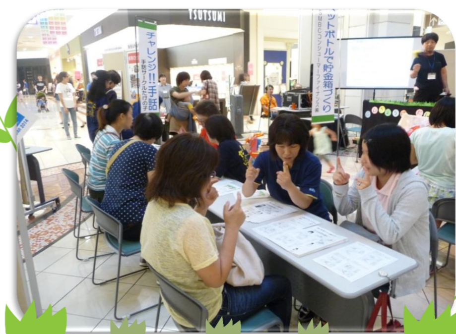
Let's まちづくり 「チャレンジ!!手」