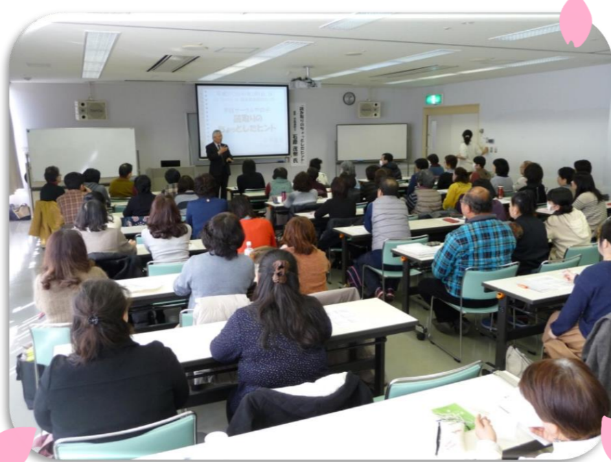
サークル主催 講習会「手話はじめての一步」